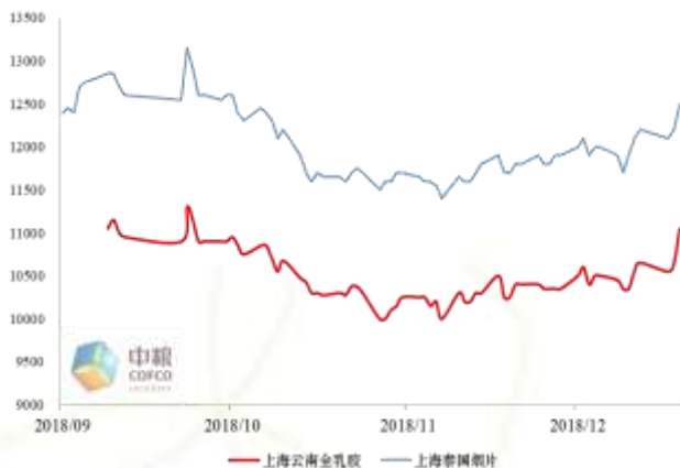
图 5：国内烟片与全乳胶价格（元/吨）